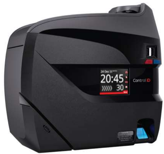
TABELA DE MODELOS